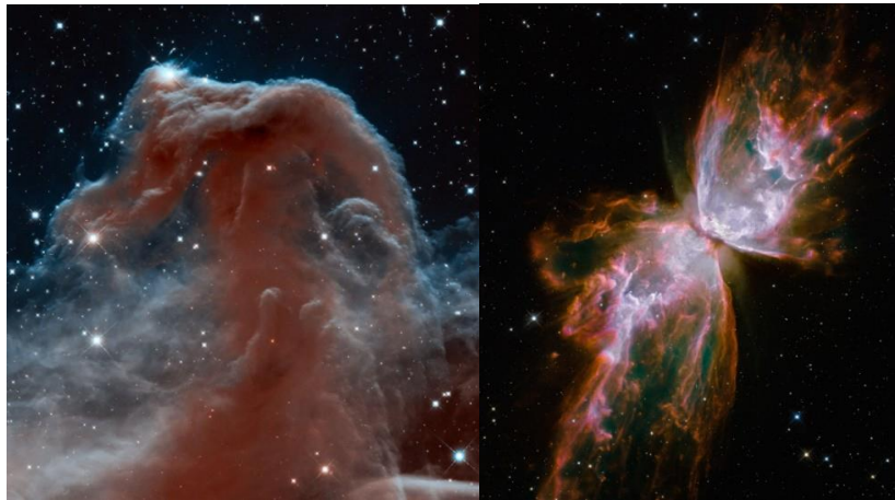
Mgławica Konia w podczerwieni

https://losyziemi.pl/swiatowy-dzien-kosmosu