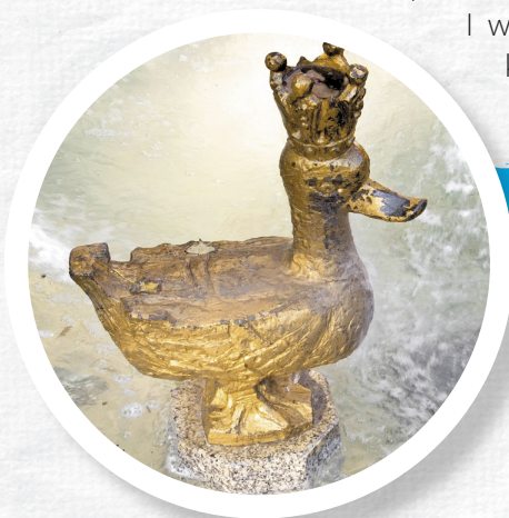
Pomnik Złotej Kaczki na ulicy Tamka w Warszawie

I właśnie tutaj, gdzie mieszkali Wars i Sawa, powstało miasto Warszawa .