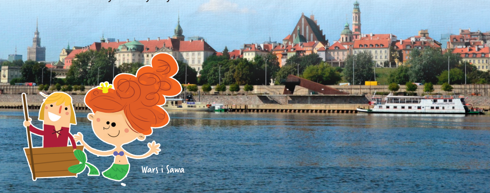
Wars i Sawa