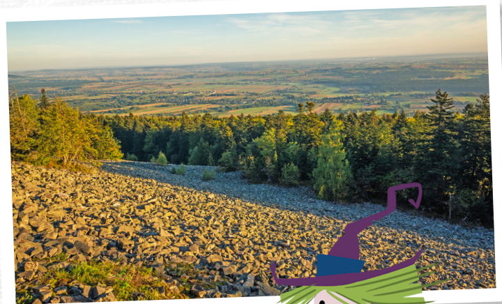
Gołoborze na Łysej Górze