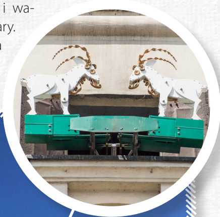
Ratusz w Poznaniu