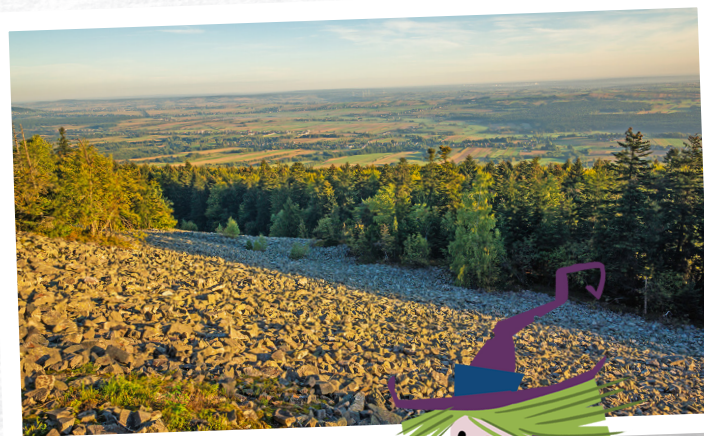
Gótorborze na Łysej Górze